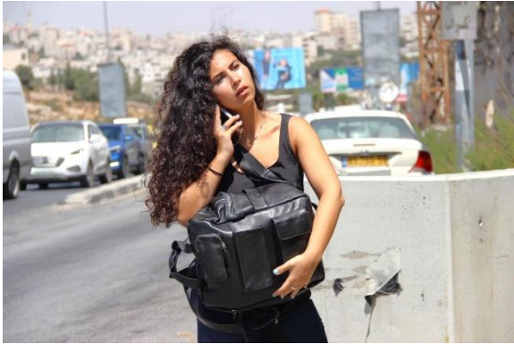
The 'BlackSac' bag is designed to shed light on the dehumanisation Palestinians face when going through Israeli checkpoints