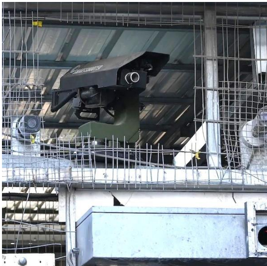
A remote-control machine gun that can be loaded with stun grenades, sponge-tipped bullets and other anti-riot tools was attached to the upper level of the gate in September. For weeks, Palestinians who passed underneath it had thought it was just a camera.