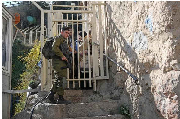
An Israeli soldier opens a gate for a Palestinian teacher and visiting E.U. congregation. The gate separates Palestinians from their streets and their homes.

Shuhada Strasse, befindet sich der Kontrollpunkt Bab al-Zawiyah, wo seit dem Wahlsieg der Rechten Palästinenser und Palästinenserinnen, die von der Arbeit oder von Besorgungen in die Stadt zurückkehren, bis zu sechs Stunden warten müssen.