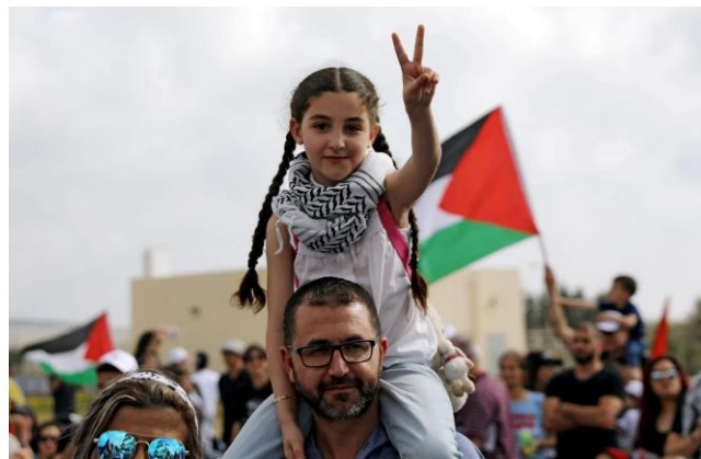
Israeli Arabs rallying for a right of return for Palestinian refugees, Atlit near Haifa, April 19, 2018.

The creation of a new national security ministry headed by Itamar Ben Gvir is already sending shockwaves through Israel's police establishment. The ministry, an expanded version of the internal/public security ministry, gives Ben Gvir — a convicted terrorist sympathizer with a long history of violence and incitement, chiefly against Palestinians — dictatorial powers over Israel's combined police forces on both