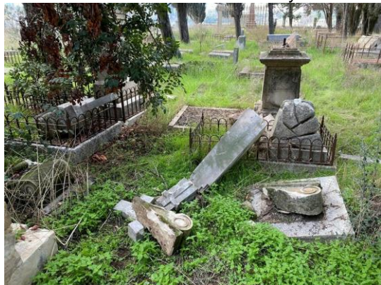
A toppled cross at the Protestant cemetery at Mount Zion, in Jerusalem, today.

Security cameras have captured the moment settlers destroyed 30 gravestones at a Protestant cemetery belonging to the Evangelical Lutheran Church in occupied Jerusalem, a source from the church said. "The hatred and aggression was mainly directed at Christian symbols, as they deliberately destroyed several crosses," he added. "What if the attack was on a Jewish cemetery? What would the Israeli response be to that? What if an Arab carried out an attack on a Jewish cemetery?"