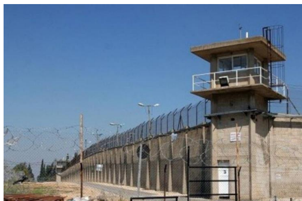
Ramleh Gefängnis