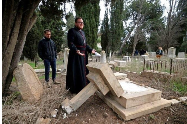
Caretakers of the Protestant cemetery inspect vandalised graves on Mount Zion outside Jerusalem's Old City on January 4, 2023.

dass sich die Christen von Extremisten angegriffen fühlen. Pater Musleh rief die Christen dazu auf, in ihr Land zurückzukehren, um sich den "gezielten Angriffen der Siedler" zu widersetzen, und bemerkte, dass "sie uns schikanieren, um uns zu vertreiben, aber wir werden bleiben, bis der palästinensische Staat mit Jerusalem als Hauptstadt errichtet ist." Musleh sagte: "Die Präsenz einer rechtsextremen Regierung in Israel macht nicht nur uns Angst, sondern der ganzen Welt."