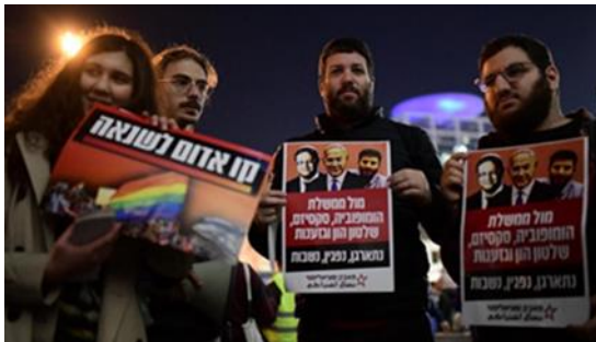
LGBTQ community in protest against government, Tel Aviv, December 29, 2022.

Der Naqab und Galiläa, in denen sich die grossen palästinensischen Bevölkerungszentren im Süden bzw. Norden des Landes befinden, bilden seit langem die Grundlage für die Bemühungen der Regierung, das Land innerhalb der Grünen Linie zu judaisieren. Insbesondere die extreme Rechte betrachtet sie - zusammen mit den so genannten "gemischten Städten" - als Teil der Frontlinie des israelischen Vorstosses zur "Wiederbesiedlung" von Gebieten, die ihrer Meinung nach aufgrund der Grösse ihrer palästinensischen Bevölkerung nicht ausreichend jüdisch geprägt sind.