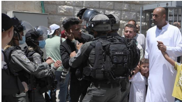
Israeli army attacks worshippers at Ibrahimi Mosque in Hebron

Al-Rajabi fügte hinzu, dass Israel durch solche Massnahmen versucht, seine vollständige Kontrolle über die Moschee zu erlangen, betonte jedoch, dass die Palästinenser weiterhin Widerstand leisten und ihr Land und ihre religiösen Heiligtümer verteidigen werden, um das systematische Judaierungsprogramm des Besatzungsstaates zu untergraben.