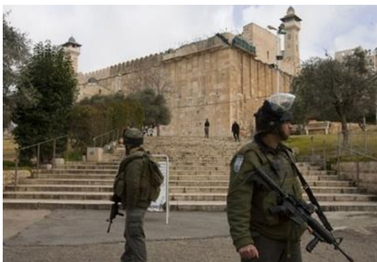
Israeli soldiers near the Ibrahimi Mosque in Al-Khalil, Hebron.

For Fourth Day, Israeli Authorities Block Provision of Drinking Water in Hebron's Ibrahimi Mosque: Blog, News, Slider, June 13, 2022