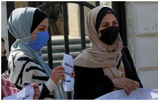
Women hold signs during a protest against the decision by Gaza's Supreme Judicial Council banning women from movement in and out of the Gaza Strip without the permission of her "guardian," in Gaza City, February 16, 2021. © 2021 AP Photo/Adel Hanambitions."

I isolated myself in my bedroom for weeks, away from my family and friends," she said. "After they smashed my ambition to work outside, I felt my life had become meaningless. I feel like a prisoner looking forward to seeing the sun and breathing fresh air on my release day," she resumed. "The release day will be when my father enables me to travel and realize my now-buried